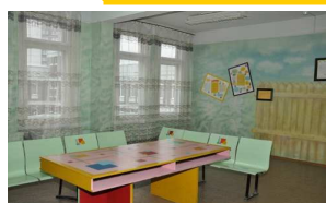
Рекреации и зоны отдыха