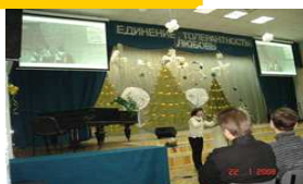
Актный и конференц-зал