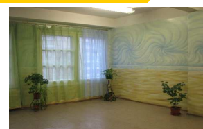
Обеденный зал и кафе